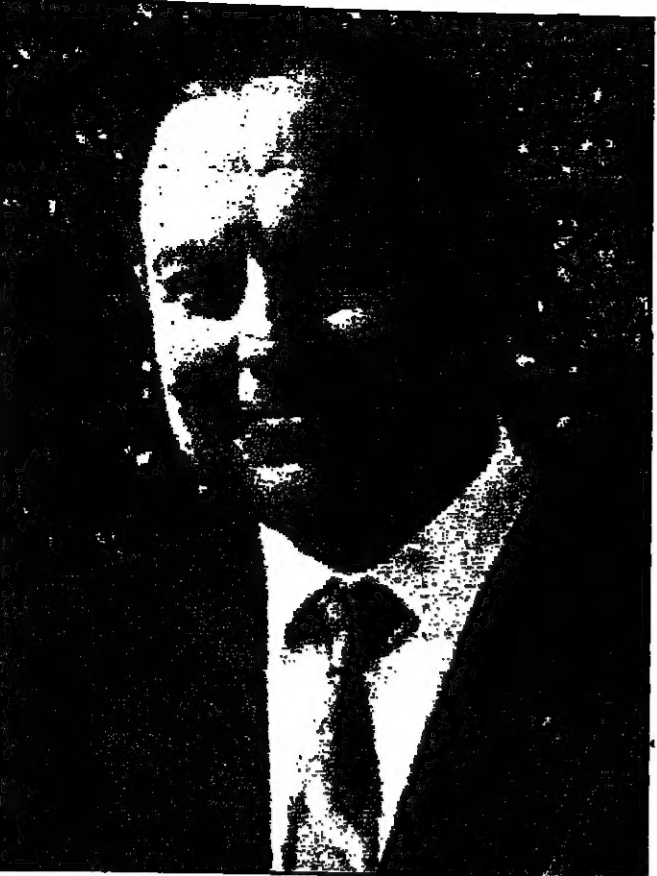
دليل أبو بكر يتخطى إلى دور أكبر من الدور التقليدي لمسجد باريس

باريس - القدس العربي - ولما لوجود تعارض بين مهته الحالية وعمله السابق كقاضي تحقيقات. وبعد كارلوس بأن كورنيلو شاركه في عملية تجريب بطعم غير أنه في باريس أصيب فيها رويديسي، وعقب كورنيلو أيضا في تجريب يباريس عام 1979 وشقيقه بتورط كارلوس. وأصبح كارلوس أسطورة خلال صراعه الأبد مع الماسكسطين في السبعينات والثمانينات، وقام مالهته الآن بتهمة قتل الفرنسيين والخير اللذان في عام 1975 بعد أن صغر في حقه منذ خمسة أعوام حكم غيابه بالسجن مدى الحياة، وهو ما يعني وفقا للقانون الفرنسي السجن لفترة أقصاها 30 عاما. وكانت المحكمة، التي تعتبر من أشهر ما في أمم القضاء الفرنسي، قد انطلقت كغير يوم الجمعة وسط إجراءات أمنية مشددة لحاضته وبينت كسر المعتاد واليهابة لكافة بالملحمة. ويبدأ كارلوس منذ ظهوره الأول وسيما ونظرا وكثير الإبتسامة، ولا يحيط المحامون في قاعة المحكمة الآن للهم الأبى اقتصاديا وأخلاقيًا بالإجراءات القضائية، ويقسمه بقية اليوم الأول من المحاكمة بوزعها بينه وبينها، وتقل كارلوس في داخل القاعة أن للهم لم يتبدد في مازلة كتابات الضبط وبعض الحمايات الحساسة التي لا تلتفت نظرون في النظر الأنيق الماسكسطيني والتمرد وتجنبت باستحسان غمراته وهسته. وعند التواجد في مرات كسر المعتاد كان الرجل الذي سطر نفسه لخدمة